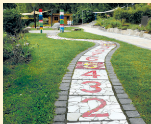
Zahlengarten Projekt im Außenspielgelände zur mathematischen Frühförderung nach Prof. G. Preiß.

In den letzten Jahren konnten durch die Mittel des Fördervereins viele tolle Sachen für die Kinder verwirklicht werden: