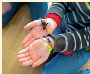
Besuch aus dem Aquazoo