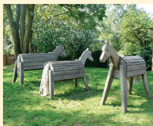
Spiel- und Klettergerätschaften für das Außengelände (z. B. die Holzpferde und der Holztraktor mit Anhänger)