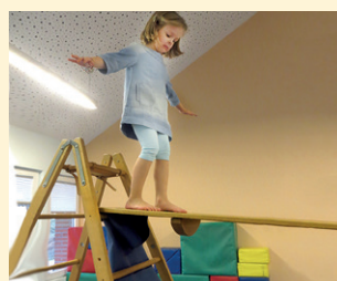
Kletterelemente für den Bewegungsraum